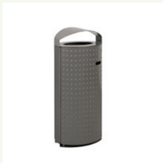
Figuur 2: Grijsen Constructo