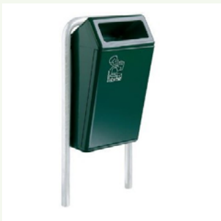
Figuur 1: Bammens Capitole

Rond evenementen en de jaarwisseling worden speciale maatregelen getroffen m.b.t. de afvalbakken. Rond de jaarwisseling worden de afvalbakken dichtgezet met vuurwerkkleppen. Rond evenementen worden de bakken twee keer per dag geleegd en worden extra mobiele containers geplaatst met een inhoud van 240 liter ( figuur 3 ).