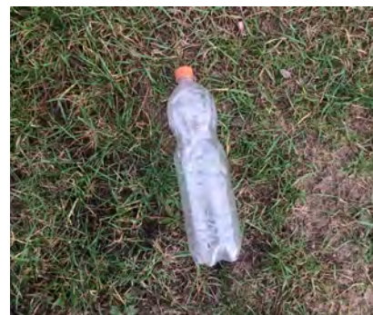
Drankflessen >1/2 liter