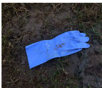
Handschoenen huishou- delijk (zacht plastic)