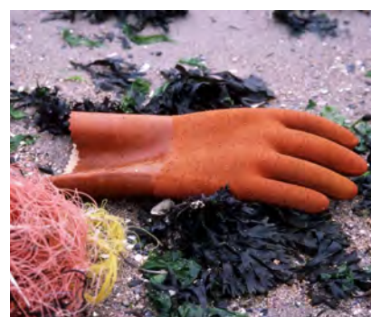
Handschoenen professi- oneel (dikker plastic)