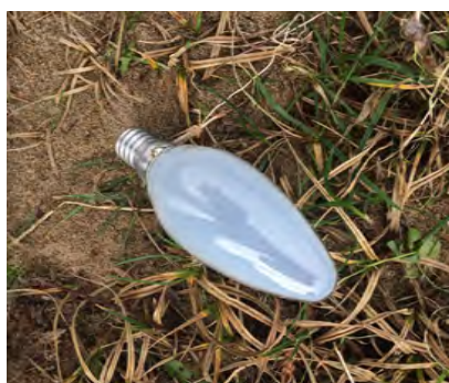
Lampen en TL lampen