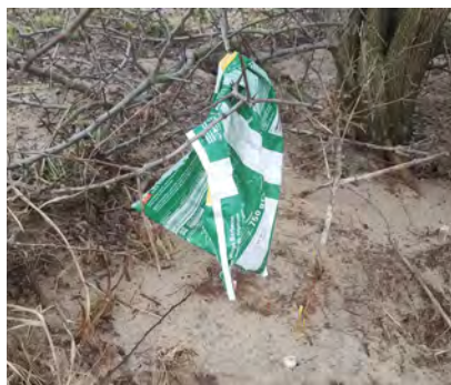
Snoep, snack en chips- verpakking