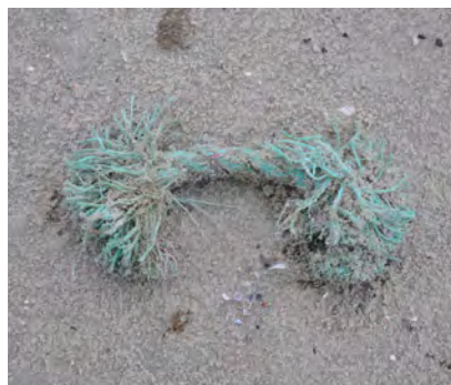
Touw diameter &gt; 1 cm