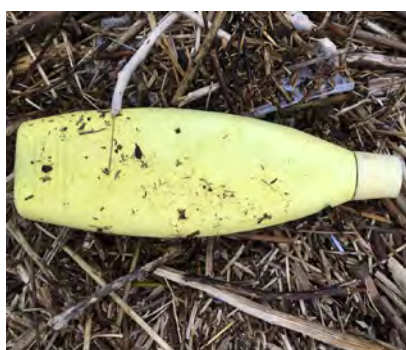
Cosmetica verpakkingen (o.a. shampoo, deodo- rant, zonnebrand)