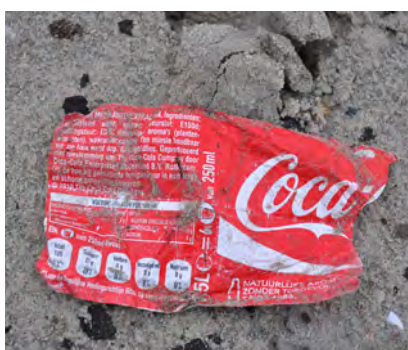
Wikkels van drankfles- sen