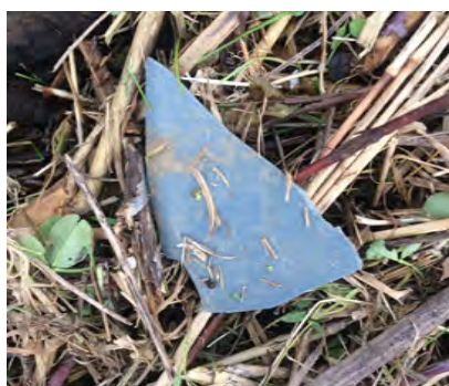
Ondefinieerbare plastic stukjes 2,5-50 cm (hard plastic)