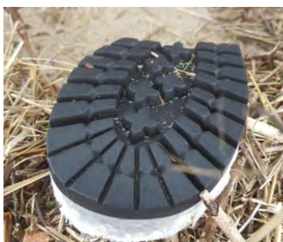
Schoenen, laarzen en slippers