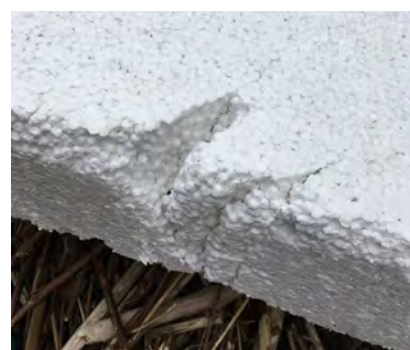
Piepschuim \geq 50 cm