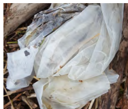
Plastic folies en/of stukken 2,5-50 cm (zacht plastic)