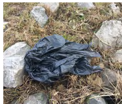
Plastic vuilniszakken en/ of stukken daarvan