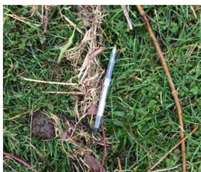
Schrijfwaren o.a. pen- nen