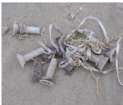
Ballonnen of resten van ballonnen (incl sierlinten)