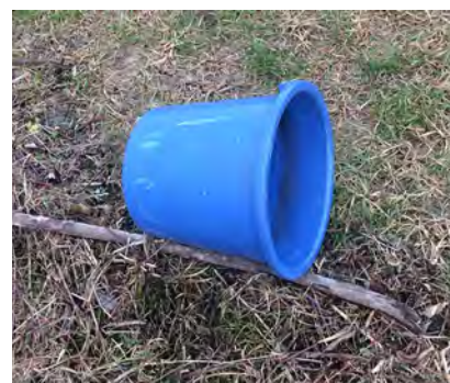
Emmers en/of stukken daarvan