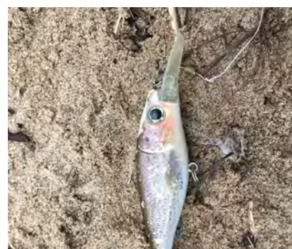
Sportvisspullen (o.a. dobbers, aasbakjes, verpakkingen van sportvisproducten)