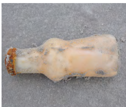
Flessen en potten en/of stukken daarvan