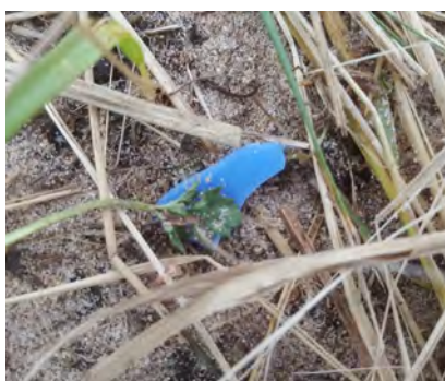
Ondefinieerbare plastic stukjes 0-2,5 cm (hard plastic)