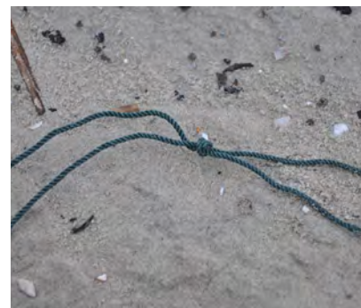
Touw en koord diameter ≤ 1 cm