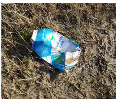
Drankkarton (o.a sap, melk, yoghurtdrink)