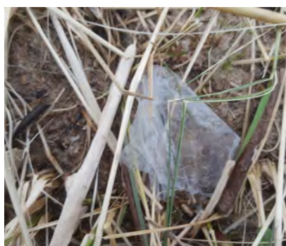
Plastic folies >50 cm (zacht plastic)