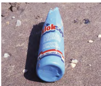
Verpakking van schoon- maakmiddelen (o.a. afwasmiddel, allesreini- ger etc.)