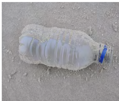
Drankflessen ≤1/2 liter