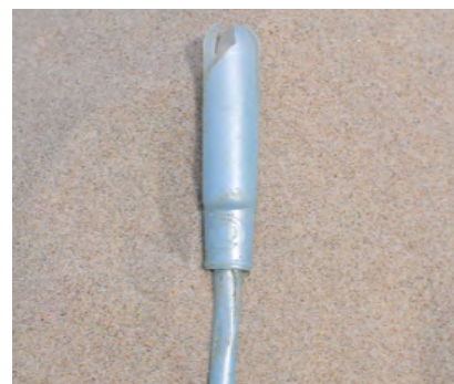
Tampons en tampon applicators en verpak- kingen ervan