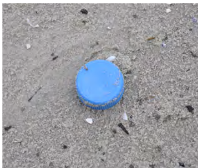
Doppen en deksels