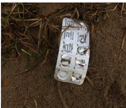
Verpakkingen (van o.a. pillen, lenzen- en vloeistof)