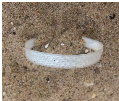
Kunststof band en/of ty-rap