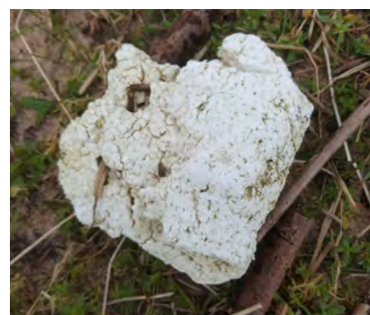
Ondefinieerbare stukjes piepschuim 2,5cm > 50 cm