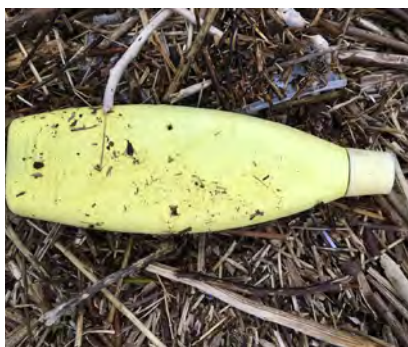
Cosmetica verpakkingen (o.a. shampoo, deodorant, zonnebrand)