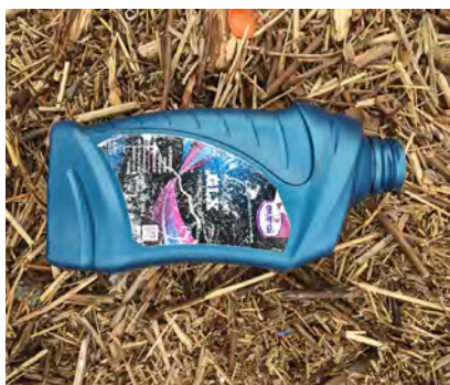
Motorolie verpakking ≤ 50 cm