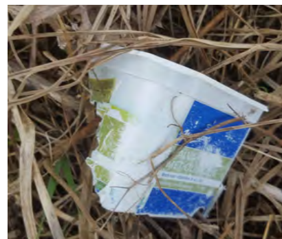
Voedselverpakkingen (o.a. yoghurt, ketchup, boter, frietbakjes etc.)