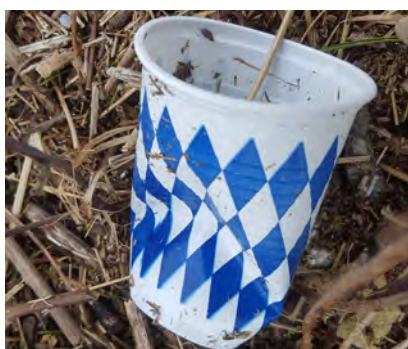
Plastic bekens en/of delen daarvan