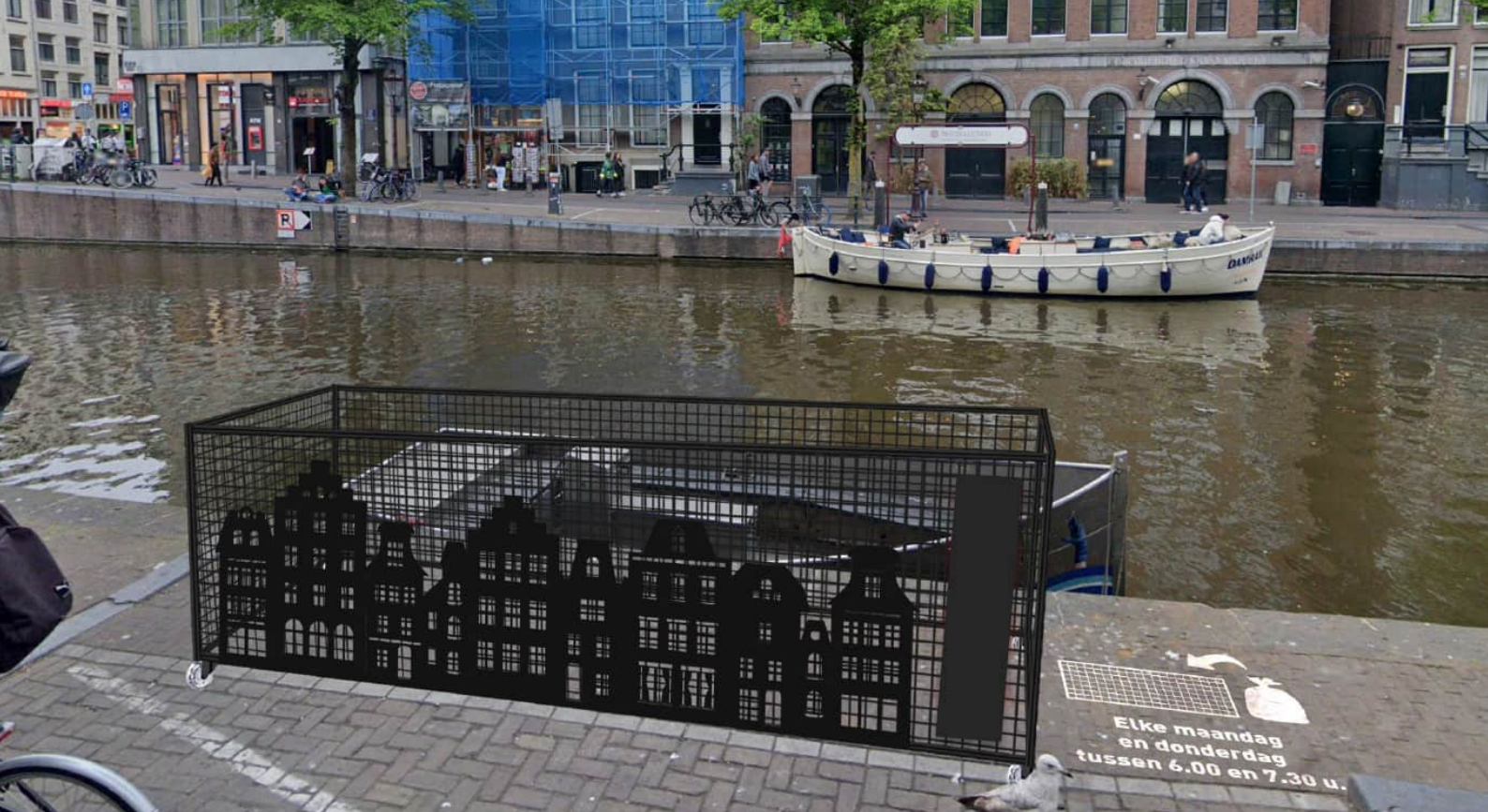
Afvalkorf met stoepcommunicatie en aanbiedtijden