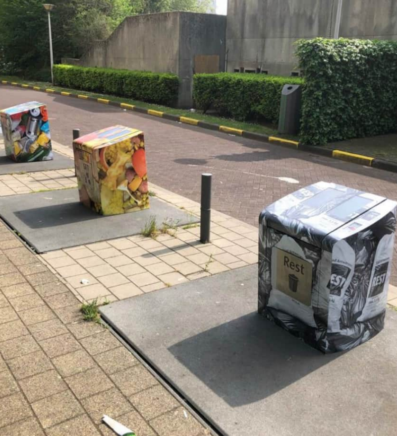
Placemaking ondergrondse containers