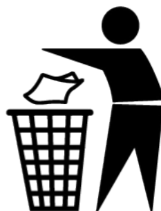
Symbool voor 'gooi je afval in de afvalbak'.

Communiceer het gewenste gedrag met behulp van pictogrammen en symbolen. Vaak spreken de tijdelijke bewoners van schepen aan de kade, zoals vluchtelingen, geen Nederlands of Engels. Daarnaast hebben zij te maken met veel stress. Het gebruik van pictogrammen en symbolen om het gewenste gedrag te communiceren kost de minste cognitieve capaciteit en is cultuur- en taal overstijgend.