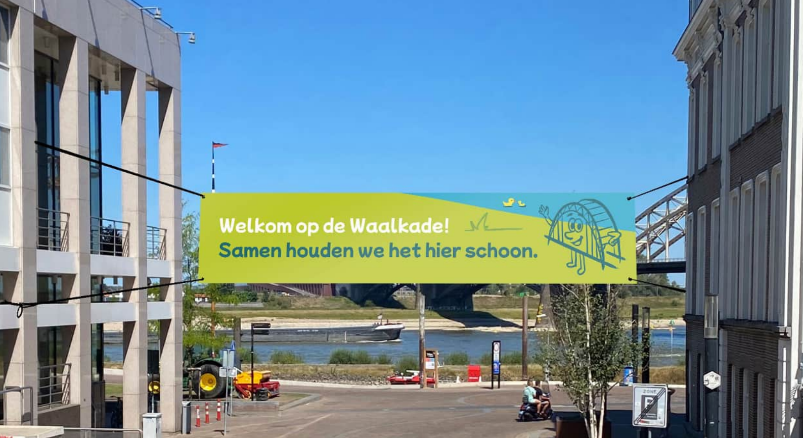
Banner bij betreden kade