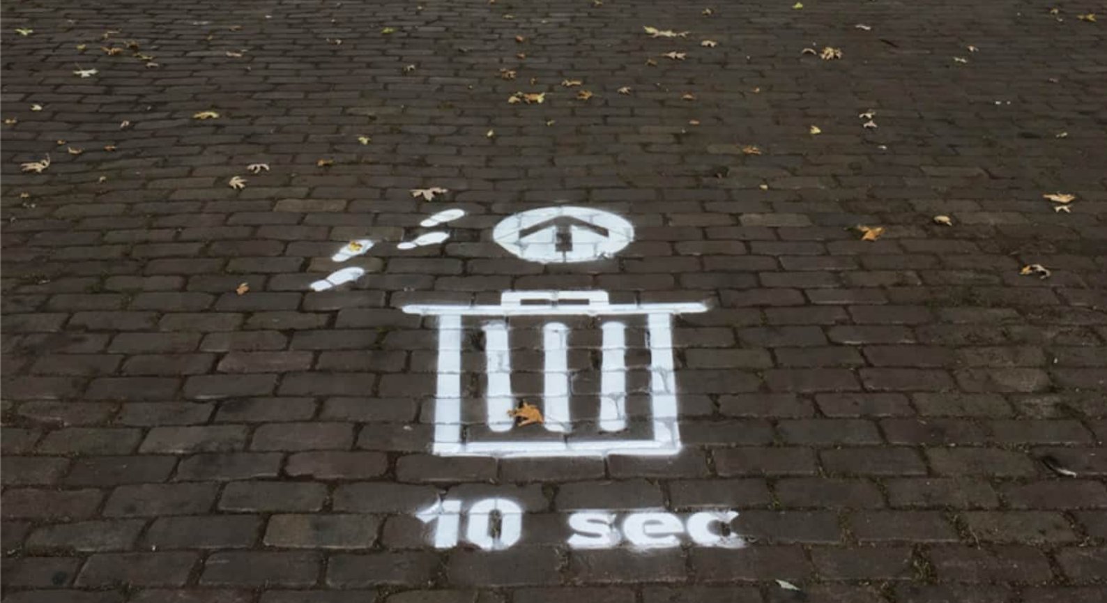
Nudge die verwijst naar een afvalbak