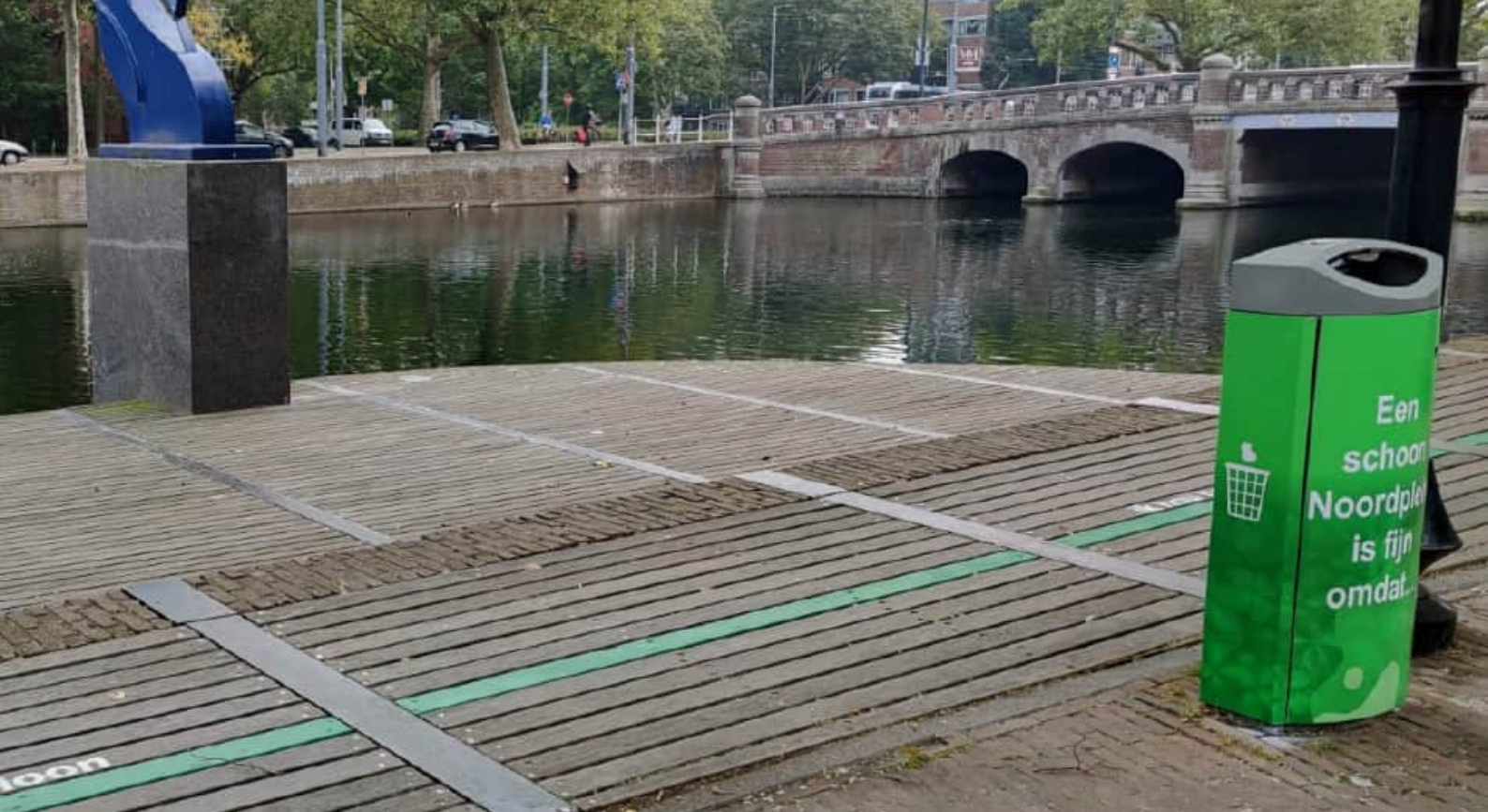
Opvallende afvalbak met zelf-overtuiging boodschap