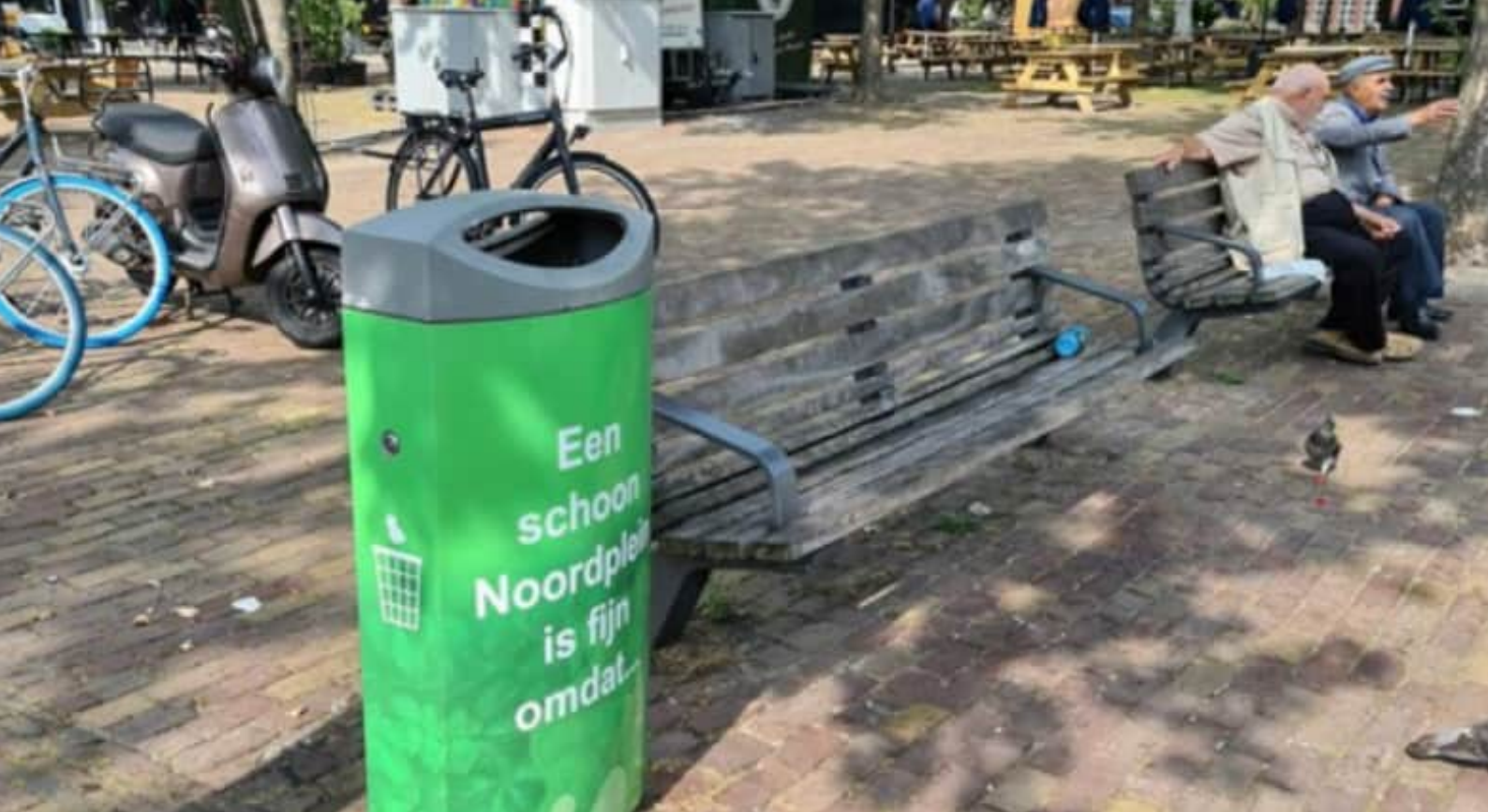
Opvallende afvalbak met zelf-overtuiging boodschap