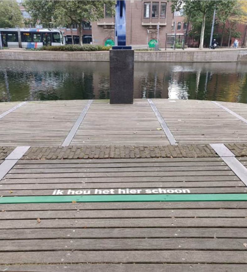
Commitment lijn op de vlonder